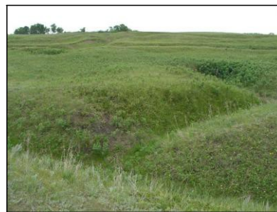
Les tranchées du camp Hughes aujourd'hui