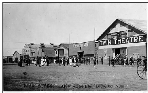
La rue principale du Camp Hughes

En 1916, 27 754 soldats ont reçu une formation au camp Hughes, faisant ainsi de ce dernier la deuxième communauté en importance au Manitoba après Winnipeg. Lorsque les travaux de construction ont atteint leur apogée, le camp pouvait se vanter d'avoir six cinémas, plusieurs magasins, un hôpital, une piscine creusée et chauffée, des bâtiments du Corps de l'intendance et du Corps des magasins militaires, des studios de photographie, un bureau de poste, une prison et plus encore. Les troupes étaient logées dans des tentes coniques blanches installées soigneusement en rangs serrés autour du camp.