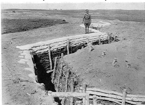
Les tranchées du camp Hughes en 1916