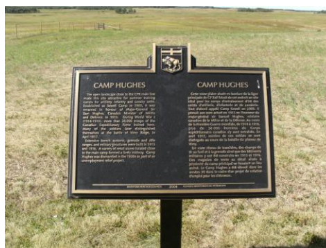
La plaque commémorative