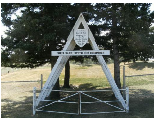
L'entrée du cimetière du camp Hughes

Une plaque commémorative a été posée sur la colline du cimetière, qui surplombe le réseau de tranchées.